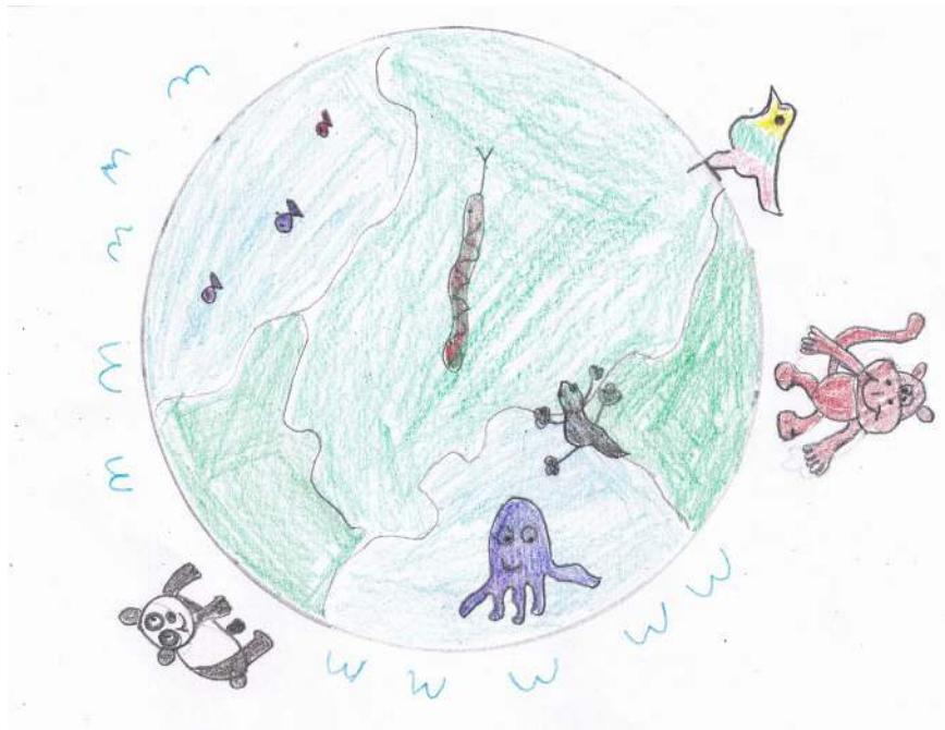
Sidra (10 Jahre) malte dieses Bild für die Buchpat_innenaktion von Bültmann und Gerrites. Mehr zu der Aktion auf S. 8.